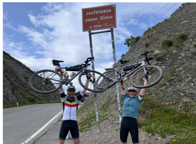
Legendärer Übergang ins Passeiertal