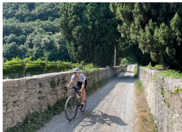
Traumhafte Gravel Bike Strecke zum Lago