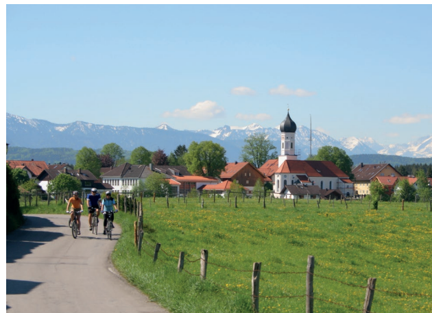
Start im schönsten Oberbayern