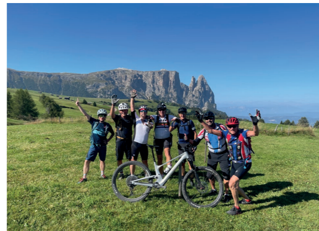
Postkartenmotiv am Schlern