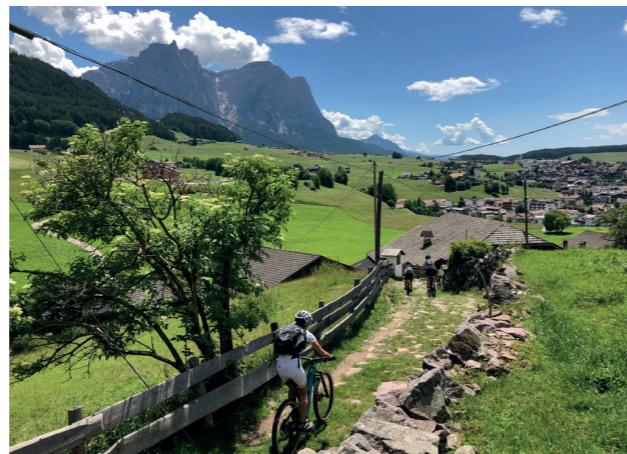
Schöner Karrenweg nach Kastelruth