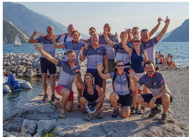
Ankunft am Gardasee