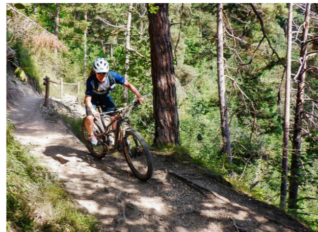
Feinste Trails in den Dolomiten