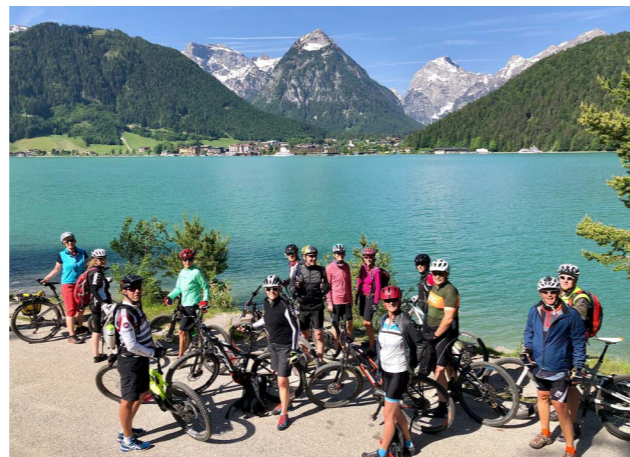
Herrlicher Blick über den Achensee