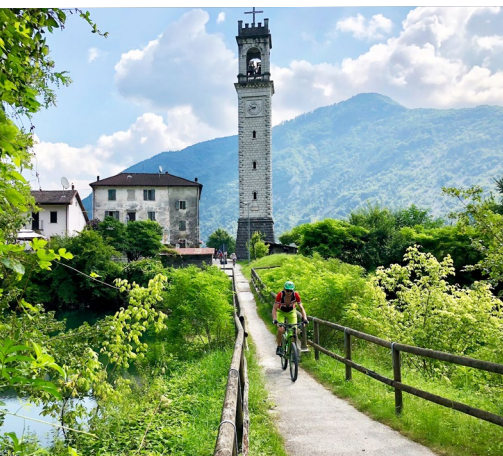
Viele versteckte Wege

» Schon die Altstadt von Sterzing ist eine Reise für sich wert. Doch hier ist nur der Auftakt zu einer Tour, deren kulturelle und landschaftliche Höhepunkte sich nur schwer toppen lassen. Selbst erfahrene Trekkingradler sind sich einig: Die Trekking Dolomiten ist eine der schönsten Radreisen überhaupt. Auch ich werde den Tag niemals vergessen, als wir das erste Mal auf der alten Bahnlinie ohne Verkehr durch die Berge rollten. Die Tour ist einfach Spitze. <<