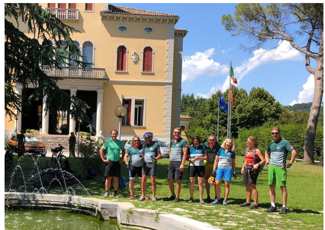
Ankunft im Veneto