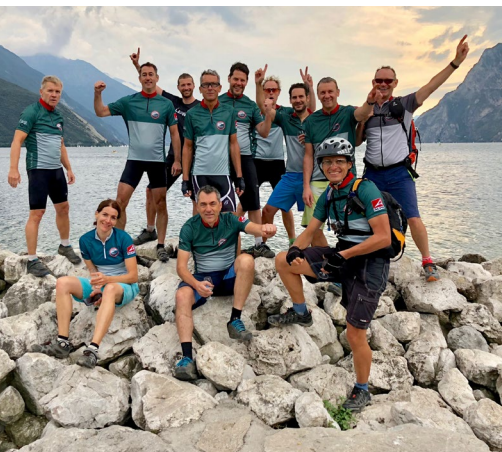
Glückliche Finisher am Lago di Garda