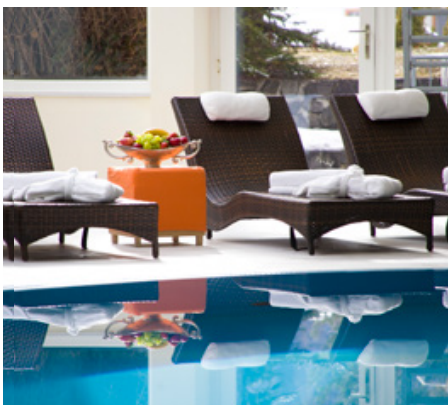
Entspannen in schönen Hotels