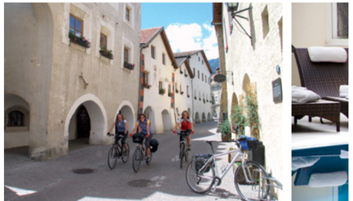
Kleinod Glurns mit einmaliger Altstadt