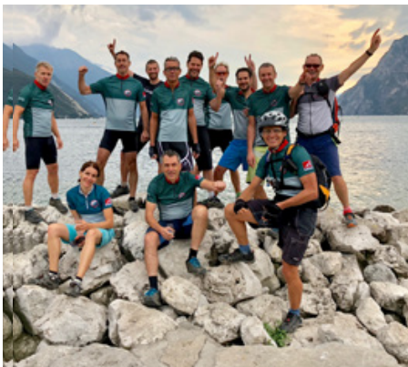
Glückliche Finisher am Lago di Garda

» Schon am zweiten Tag meistern wir den Alpenhauptkamm. Der Blick vom Plamort auf die 3000er Spitzen des Ortler Massivs ist berausend. Als zusätzliche Belohnung winken nette Mittagsquartiere und gute Hotels. Schließlich ist es Urlaub. Mir gefällt bei der Trentino besonders die gelungene Mischung von Trails und unvergesslicher Landschaft. Die Abfahrt zum Gardasee ist der absolute Hammer. Fast 2000 Höhenmeter immer nur bergab! <<