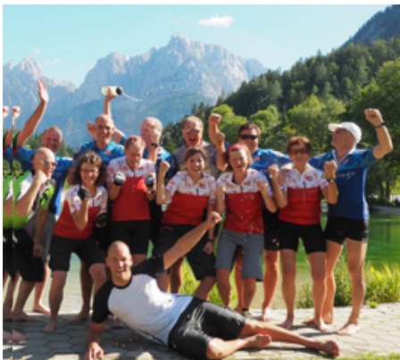
Feiern bei der Ankunft in Kranjska Gora

» Nicht jeder leidenschaftliche Mountainbiker vollführt beim Wort „Trail“ wahre Freudensprünge. Für alle sportlich Aktiven, die gerne auch steil 1200 oder 1300 Höhenmeter klettern, sich bei den Abfahrten aber nicht mit Wurzeln oder steinigen Stufen beschäftigen wollen, ist die Transalp Slowenien mehr als ideal. Die gesamte Strecke führt überwiegend auf guten Schotterwegen durch die herrlichste Berglandschaft. Teils steil und einsam, aber ohne fahrtechnische Akrobatik. Die kurzen technischen Passagen sind auch schiebend schnell überwunden. «