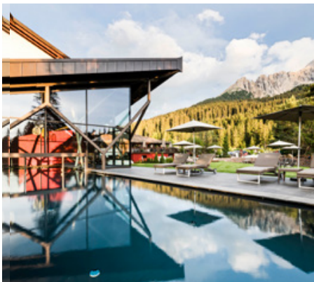
Wellness mit Latemar-Blick

» Selten waren sich sechs ALPS-Guides beim Tourencheck so einig: Die Transalp Latemar ist ein Muss für jeden Level-4-Fan. Landschaft und Wege sind auf dieser Strecke ideal kombiniert. Dazu kommen durchweg gute Hotels. Obwohl wir zweimal die Seilbahn nutzen, verliert die Strecke nicht an Anspruch. Im Gegenteil: Die Downhillmeter fordern Kondition und Konzentration gleichermaßen. Jeder Tag bietet ein Super-Panorama. Was will man mehr? <<