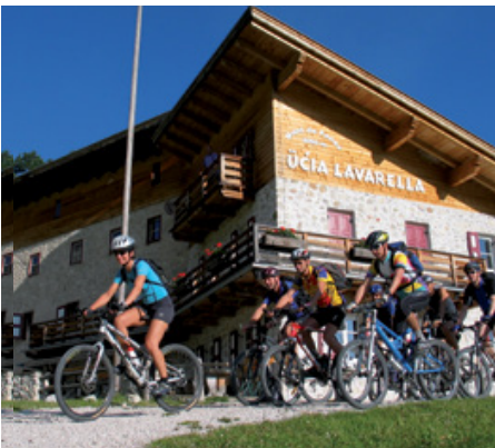
Früher Start an der Lavarella Hütte

» Die Transalp Dolomiti ist für mich eine der schönsten Touren überhaupt. Die weißen Dolomitenberge im Naturpark Fanes und im Angesicht der Cinque Torri gehören zu den Berglandschaften, die jeder einmal in seinem Leben gesehen haben muss. Auch die Überquerung des Alpenhauptkammes am Pfitscher Joch ist gigantisch. Das Sahnehäubchen setzt jedoch die Strecke über den Monte Grappa auf. Auf keinen Fall verpassen! «