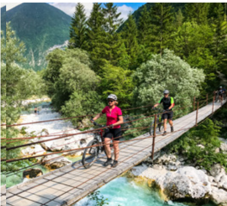
Abenteuerliche Brücke über die Soca

» Alle waren sich bislang einig: Die Transalp Adria ist eine besondere Tour. Die Streckenführung verlässt die ausgetrampelten Radwege und erschließt auf teils sportlichen Pfaden herrlichste Landschaften. Besonders beeindruckend sind die landschaftlichen Kontraste. Ein echtes Highlight ohne viel Technik. «