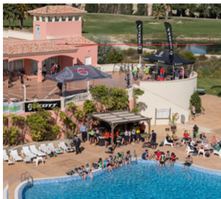
Sundowner am Pool und an der Poolbar