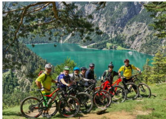
Herrlicher Blick über den Achensee