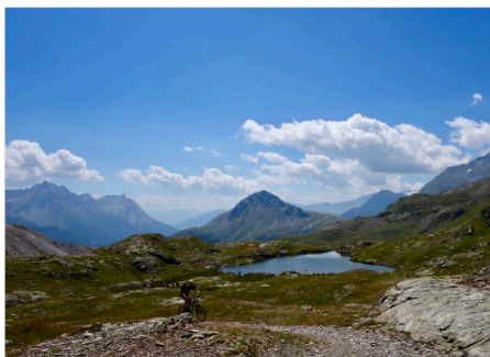
Jeden Tag über 2000 m Höhe