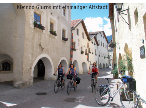
Kleinod Glurns mit einmaliger Altstadt