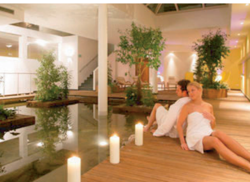
Entspannen in schönen Hotels