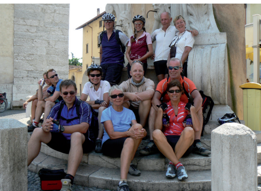
Gruppenfoto vor Italiens bester Eisdiele