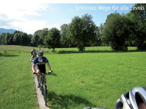
Schönste Wege für alle Levels

ressierte dürfen nicht fehlen. Zudem fahren wir natürlich tolle Touren.