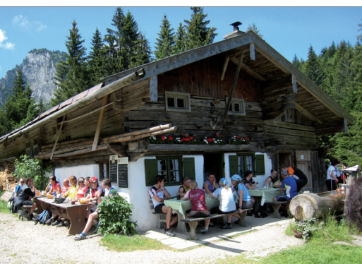
Urige Hüttenrast an der Benediktenwand