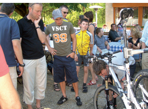
Fachsimplen mit Experten nach der Tour