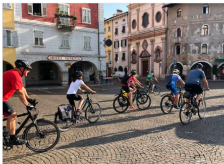
Ankunft in der historischen Altstadt von Trento