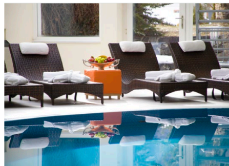
Entspannen in schönen Hotels