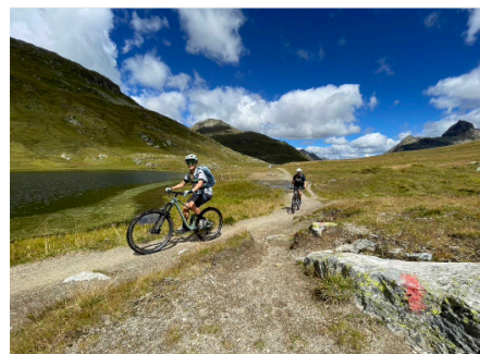
Hochalpine Wege garantiert