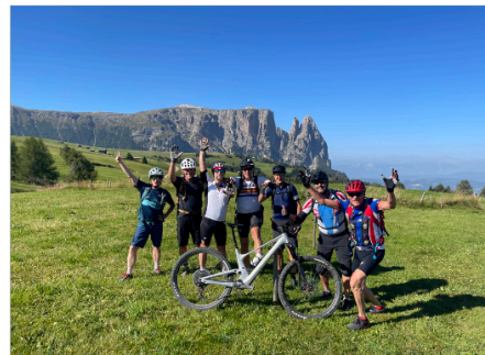
Postkartenmotiv am Schlern