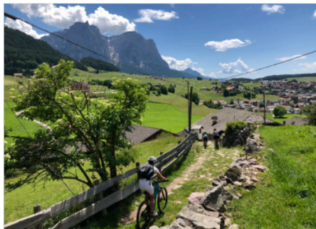
Schöner Karrenweg nach Kastelruth